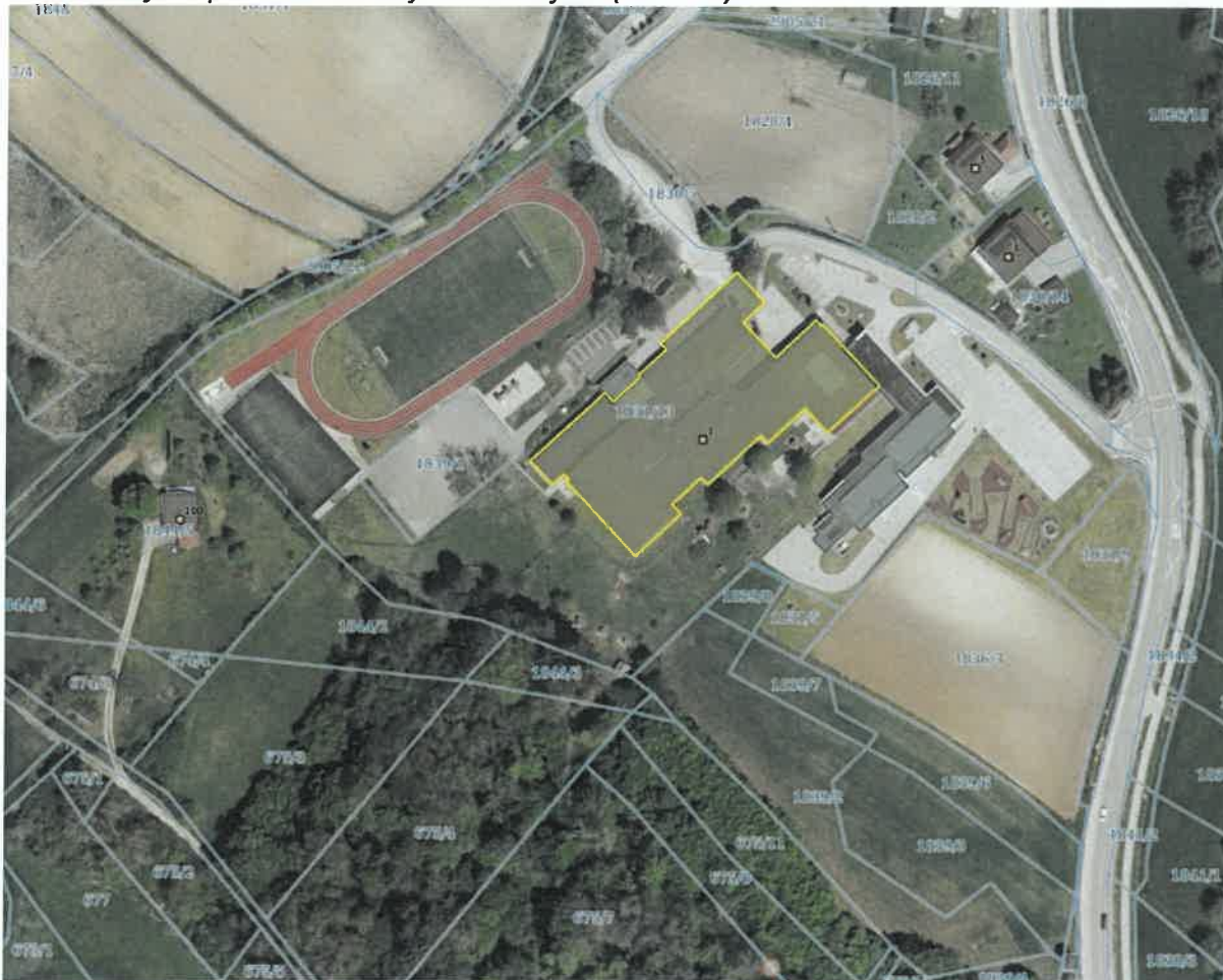
Slika: Ortofoto posnetek lokacije OŠ Šmarjeta (rumeno)